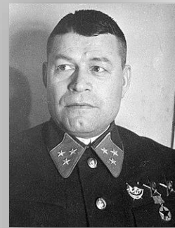
Генерал Федор Яковлевич Костенко