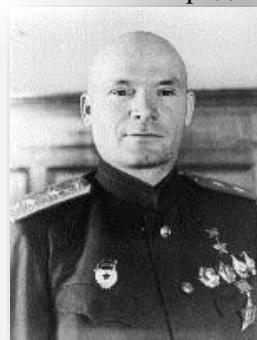
Генерал-майор Д. Д. Лелюшенко

30 сентября 1941 г. Танковая группа армии Гудериана, протаранив оборону Брянского фронта, хлынула на Орел. Чтобы задержать врага, по решению Ставки в район Мценска стали сосредотачиваться соединения 1-го гвардейского стрелкового корпуса генерал-майора Д. Д. Лелюшенко. События развернулись настолько стремительно, что к исходу 2 октября гитлеровские войска вышли на подступы