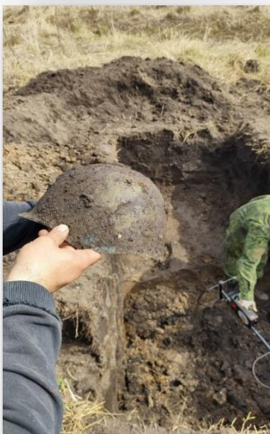
Фрагмента стального шлема СШ-40

При эксгумации рядом с бойцами были найдены две малые сапёрные лопаты, спички завёрнутые в упаковку из-под индивидуального перевязочного пакета, ложки и монета 50 копеек 1922 года. К сожалению, личности красноармейцев установить не удалось, медальонов и личных подписных вещей найдено не было. Известно лишь, что погибли бойцы в зимний период, так как на ногах одного из бойцов сохранились полупьексы (наносники) - специальные приспособления для хождения на лыжах в валенках.