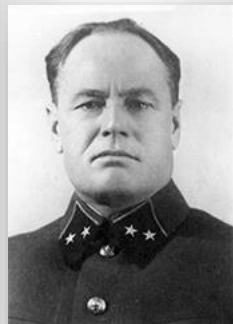
Генерал-майор Авксентий Михайлович Городнянский

Враг был задержан в своём продвижении на Москву. Елецкая операция стала частью общего контрнаступления советских войск под Москвой, в ходе которой был нанесен значительный урон фашистским войскам.