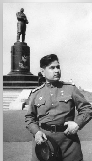
Летчик-истребитель Алексей Петрович Маресьев