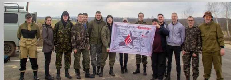
Поисковый отряд «Ермолов»