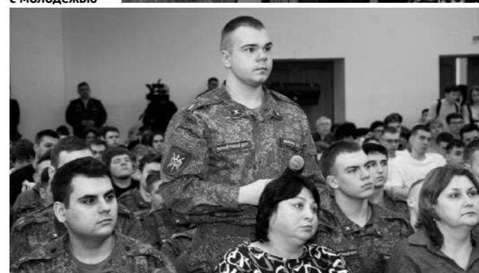
Доверительный разговор с молодёжью

он вёл с молодёжью честный, доверительный разговор.