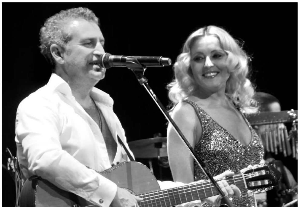
Агутин и Варум — самая крепкая пара отечественного шоу-бизнеса