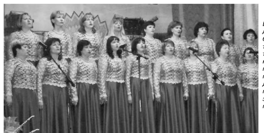
В знак благодарности работники культуры подготовили прекрасную праздничную программу для трудового коллектива знаменитого племзавода