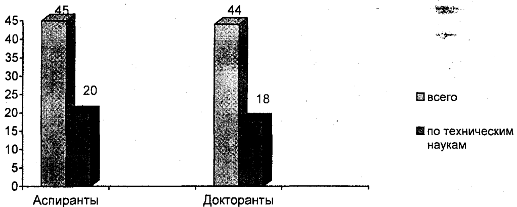
Рисунок 1. Доля женщин среди аспирантов и докторантов по техническим специальностям

Отмеченная тенденция роста доли женщин, имеющих ученые степени, является результатом увеличения их доли среди получающих послевузовское техническое образование (в аспирантуре и докторантуре). Следует, однако, отметить, что по сравнению с другими областями науки женщины представлены здесь все еще незначительно. Если в целом женщины составляли на конец 2003 г. 45% всех аспирантов и 44% докторантов в стране, то по техническим отраслям соответственно 20 и 18% [4, С.85,87].